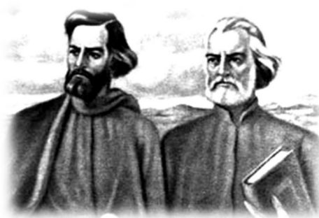
Константин и Мефодий