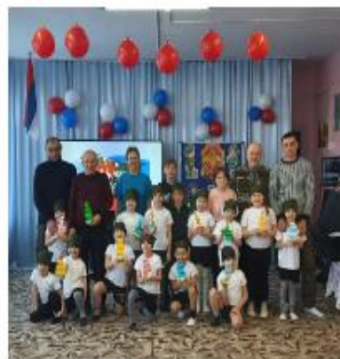
Подготовительная "Б" группа