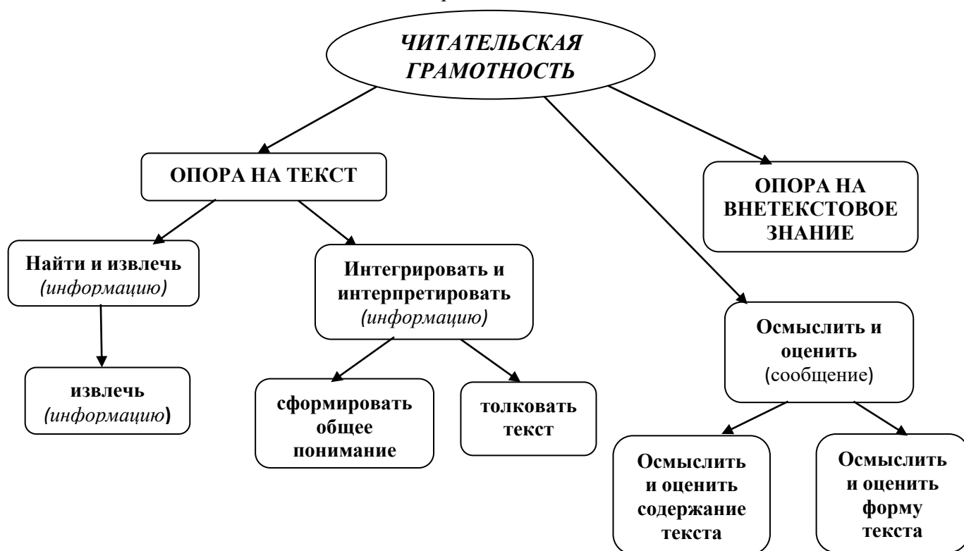
Схема 1. Компоненты читательской грамотности

Требования к ее уровню представлены в планируемых результатах ФГОС «Чтение: работа с информацией» и результатах освоения основных учебных программ по всем предметам.